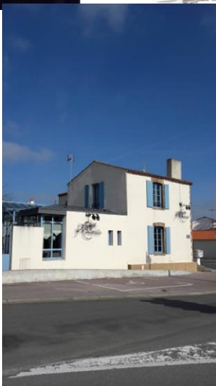
Le Petit St. Tomas – La Garnache