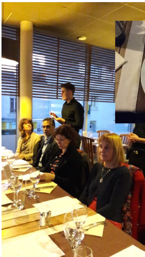
Le Karo – La Roche sur Yon